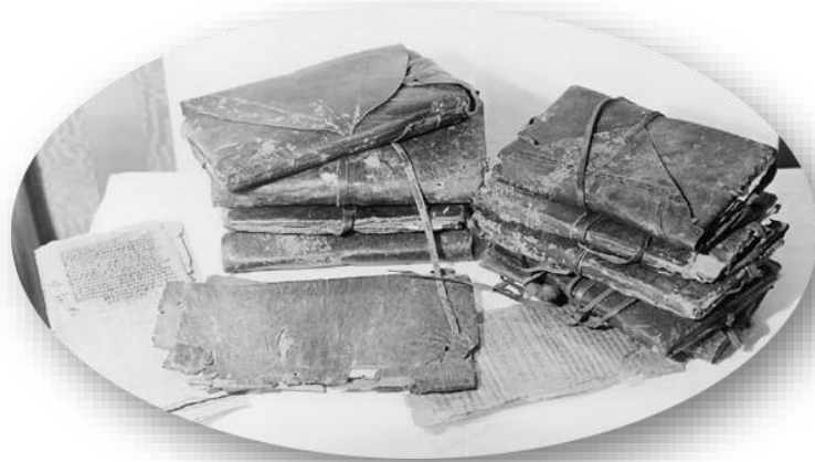
· Códices y manuscritos de la Biblioteca de Nag Hammadi ·

Los “ Evangelios o Textos Gnósticos de Nag Hammadi ” apuntan, principalmente, a “las Enseñanzas del Señor”, a las “otras muchas cosas que hizo Jesús”, 31 entendiendo la Gnosis Cristiana , como “una segunda conversión salvadora” al modo que explica “Clemente de Alejandría” en sus “ Stromata ”: